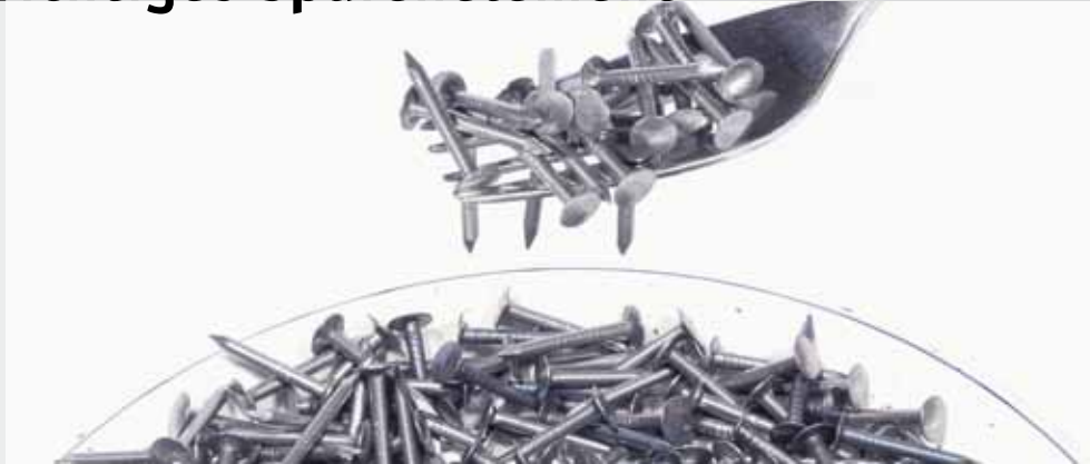
Schon vor einer Diagnose können Erschöpfung, Schlafprobleme oder Schwindel auf Eisenmangel hindeuten.

Ein Eisenmangel zeigt sich typischerweise in einer Blutarmut, einer Anämie. Davon ist die Rede, wenn der Hämoglobingehalt der roten Blutkörperchen die Grenze von 13g/100 ml bei