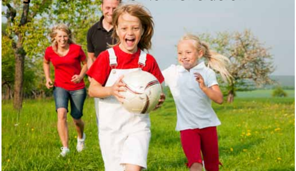
Kleine Bewegungsübungen über den Tag hinweg fördern die Konzentration.

Fragen über Fragen, und niemand kann sie schlüssig beantworten. Klar ist, dass all die aufgeführten Fakten die Konzentrationsfähigkeit der Kinder negativ beeinflussen. Die entscheidende Voraussetzung für das erfolgreiche Lernen ist eine gute Konzentrationsfähigkeit. Diese kann durch verschiedene Massnahmen kurz- oder langfristig beeinflusst werden. Langfristig gute Voraussetzungen werden beispielsweise durch genügend Erholungszeit, eingeschränkten Medienkonsum, ausgewogene Ernährung oder genügend Bewegung erreicht. Kann die Konzentrationsfähigkeit von Schulkindern durch kurze Bewegungssequenzen von ein bis zwei Minuten während des Schulunterrichts positiv beeinflusst werden? Die Resultate einer Studie der Universität Basel waren sehr erfreulich: 93 Prozent der Primarlehrkräfte waren der Meinung, dass sich die Kinder nach einer