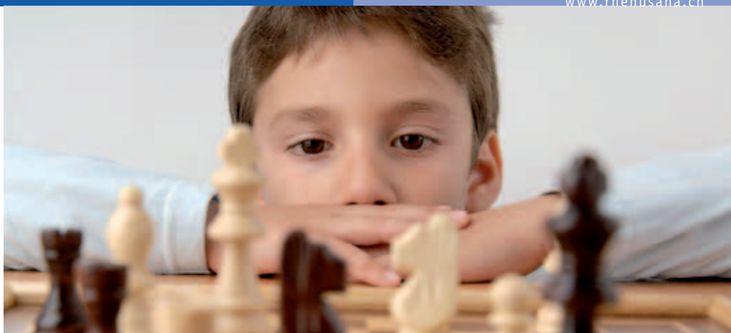
Begeisterten Kindern fällt es leichter, sich zu konzentrieren.

TIPP: Animieren Sie Ihr Kind zu kurzen Bewegungssequenzen. Nach einer Viertelstunde gezielter Kopfarbeit kann beispielsweise eine Minute mit Bällen jongliert werden. Oder lassen Sie das Kind einen Text zusammenfassen – ste-