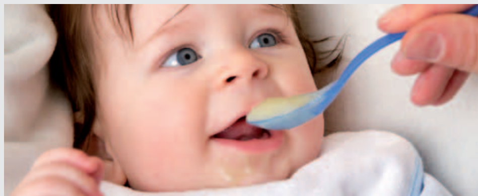
Eine ausreichende Vitaminversorgung ist bereits bei Säuglingen und Kleinkindern wichtig.

Bereits Säuglinge benötigen zusätzliche Vitamine – auch wenn sie gestillt werden. Fachärzte empfehlen, Neugeborenen drei Mal Vitamin K zu verabreichen: am ersten Lebenstag, zwischen dem fünften und siebten Lebenstag und in der