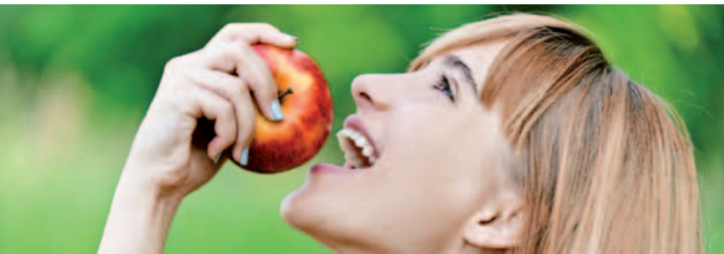
Prävention – lieber jetzt vorbeugen, als später heilen.

In Australien. Ich vermisse hier die Vielfalt an Landschaften: das Salzwasser oder die Wüste. Wenn ich ganz alleine in der Wüste bin, bin ich sehr glücklich. Es spielt keine Rolle, wohin man schaut, es gibt kein Haus, kein Zeichen von Zivilisation. Das liebe ich. Und dann das pure Gegenteil in der Nähe eines wilden Sees: Das ist für mich Leben. Und dafür muss ich nach Australien gehen.