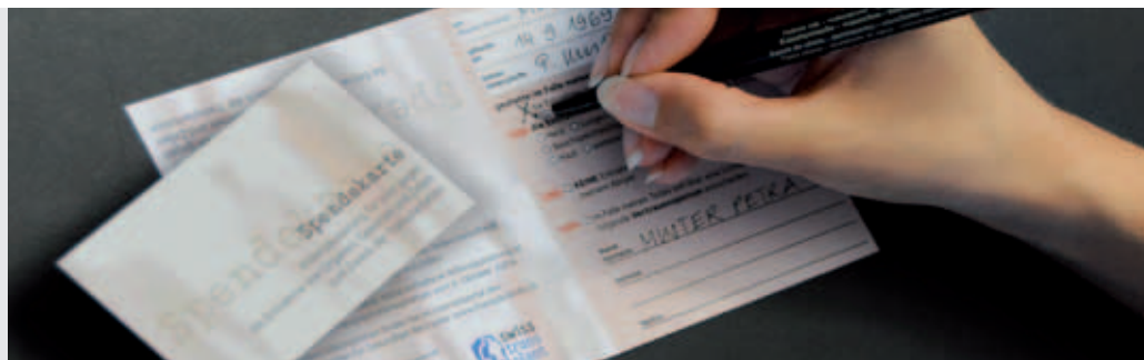
Spenderkarten können über das Internet ausgedruckt und unterzeichnet werden.

Am häufigsten werden Nieren transplantiert. Folgende Organe können ebenfalls gespendet werden: Herz, Lunge, Leber, Bauchspeicheldrüse, Langerhans'sche Inseln der Bauchspeicheldrüse und Dünndarm. Zurzeit haben sich in der Schweiz sechs Zentren dafür qualifiziert (Genf, Lausanne, Bern, Zürich, Basel und St. Gallen).