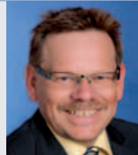
Geschätzte Kundin Geschätzter Kunde