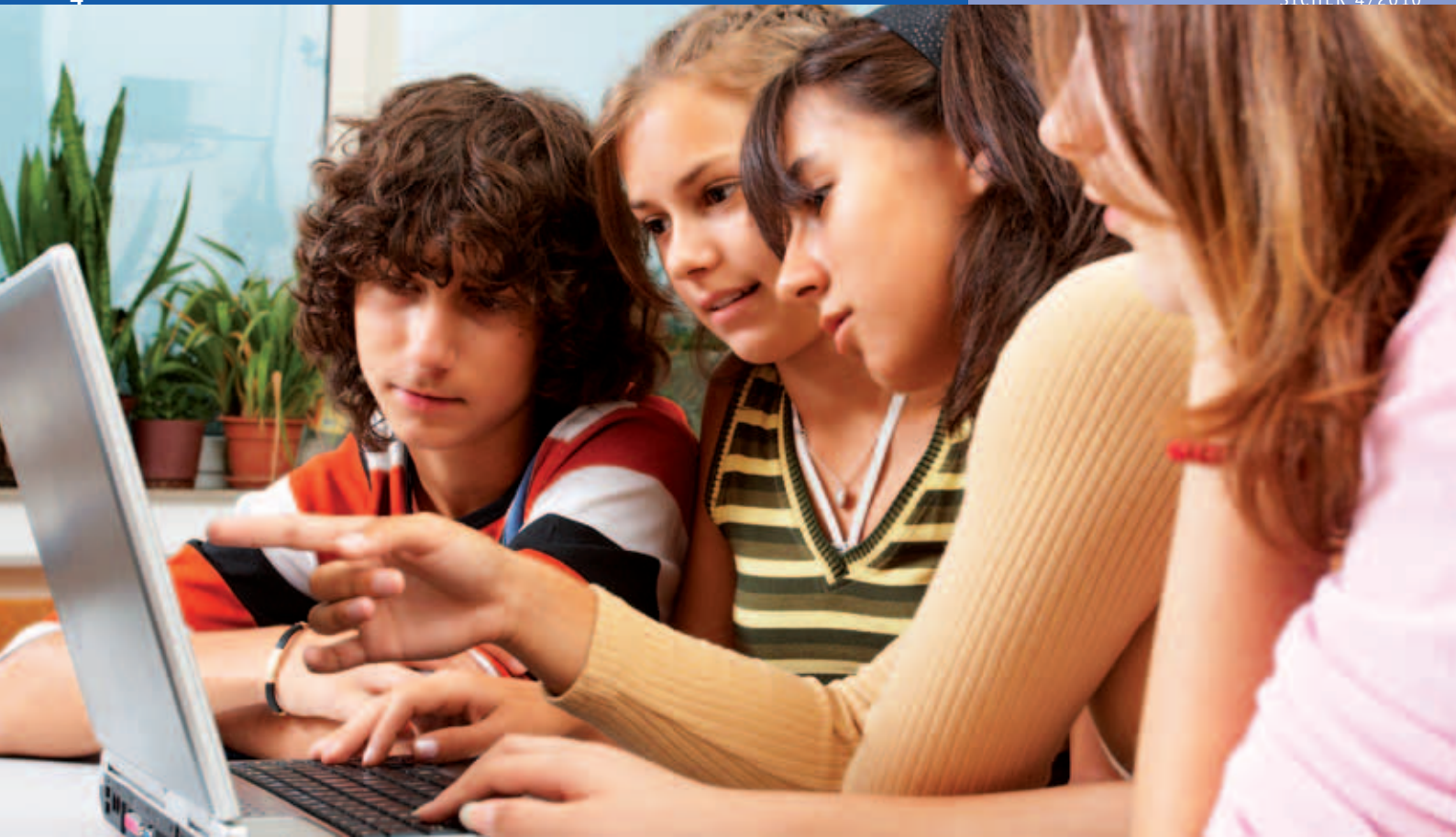
Internetsüchtige Kinder und Jugendliche verbringen immer weniger Zeit mit ihren Freunden in der realen Welt.